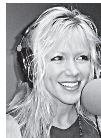
Por: Marisol Muñoz-Kiehne, Ph.D.

El período entre los nueve y los trece años es desafiante, tanto para nuestros muchachos como para sus familias. Los adultos a su alrededor debemos prepararnos para esta etapa en la que ya no son niños pequeños, pero aún no se consideran adolescentes, aunque a veces se comporten como tal.